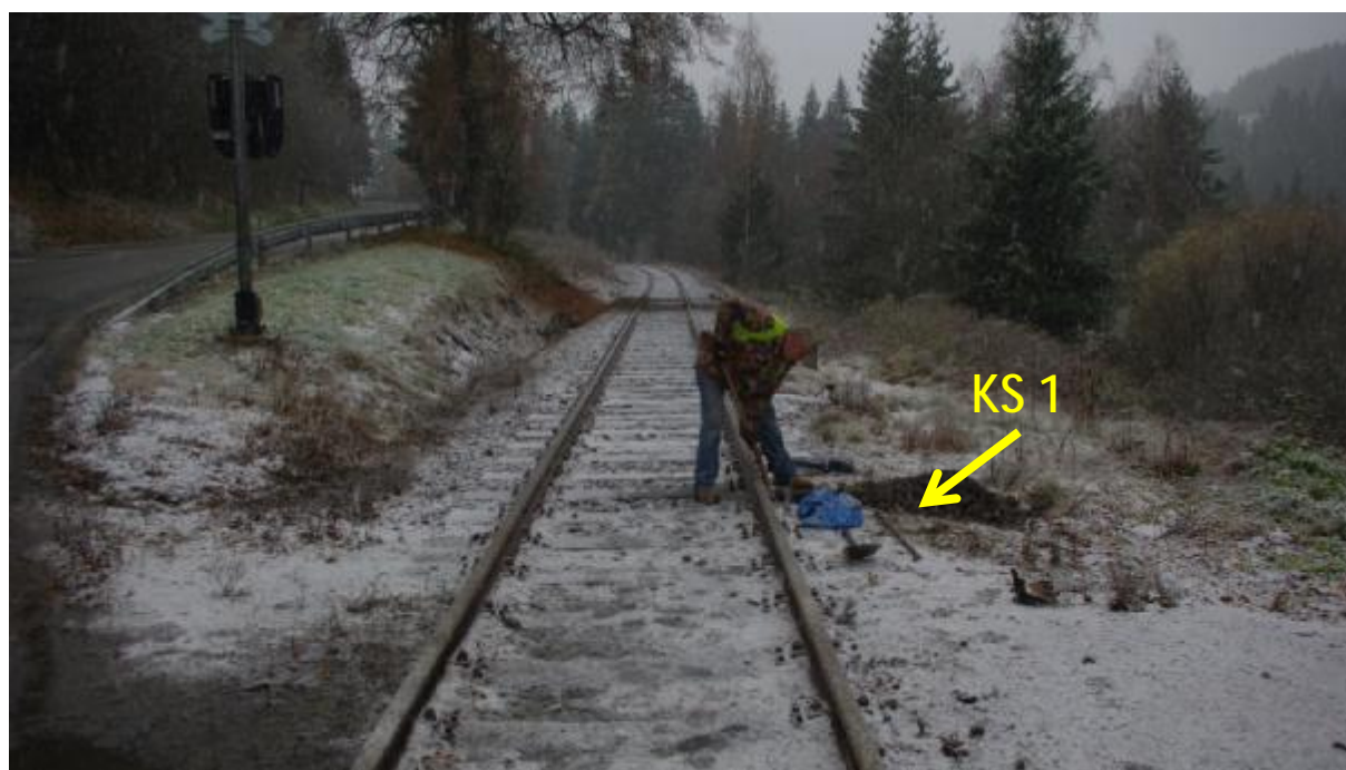
Místo realizace kombinované sondy (kopaná část/zarážená sonda)