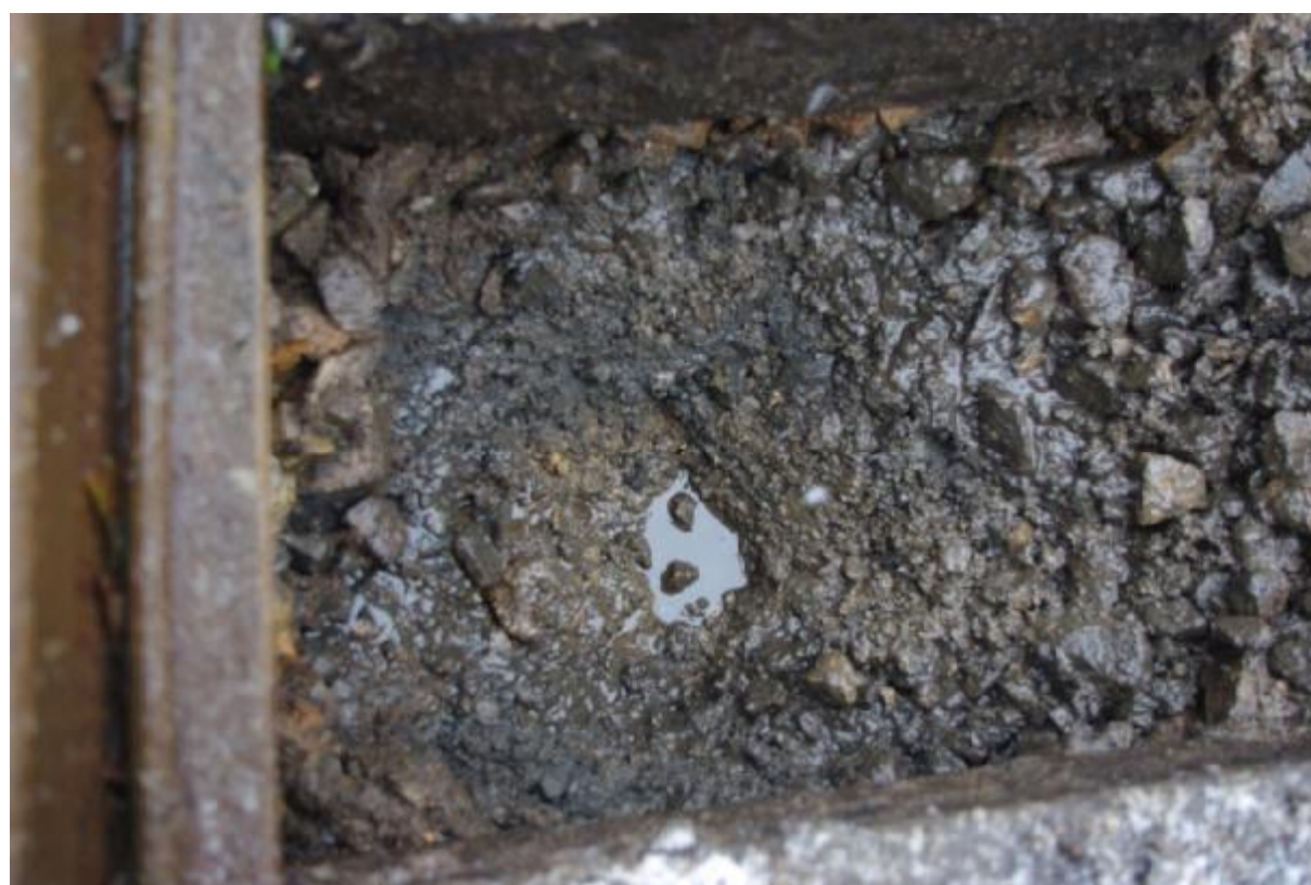
Pohled na dno kopané sondy před realizací SZZ