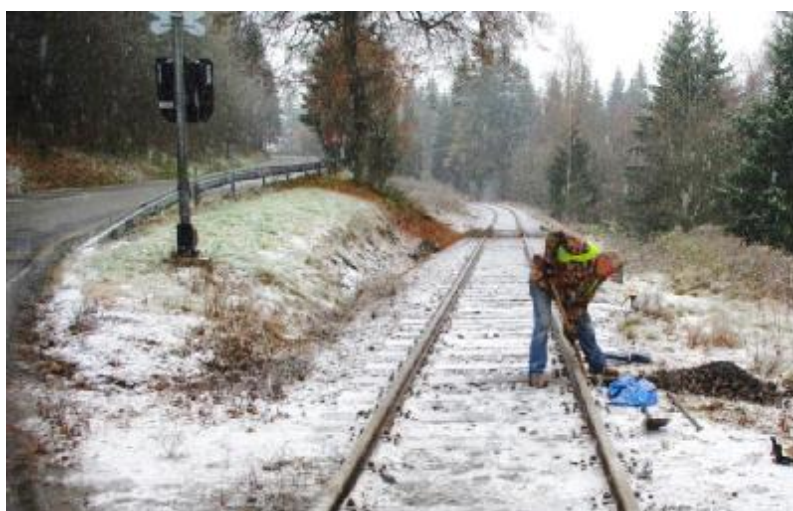
Obr. 1 Pohled na místo provádění sondáže

Jedná se o úroňový železniční přejezd přes pozemní komunikaci I. tř. č. 4 na JZ periferii města Vimperk.