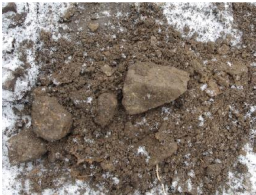
Detail zemin zemní pláň